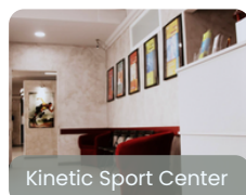
Kinetic Sport Center